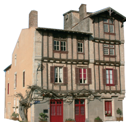
ses maisons à pans de bois

St-Loup sur Thouet, petite cité de caractère