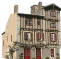
ses maisons à pans de bois

Le Château : Joyau de l'architecture française, de style Louis XIII, constitué avec ses jardins et son orangerie un ensemble historique de premier ordre. Le Donjon fut construit par les de Dercé au XIV e siècle, et le château actuel fut reconstruit au XVII e siècle par la famille Gouffier. Charles Perrault s'en inspira pour écrire le conte du Chat Botté.